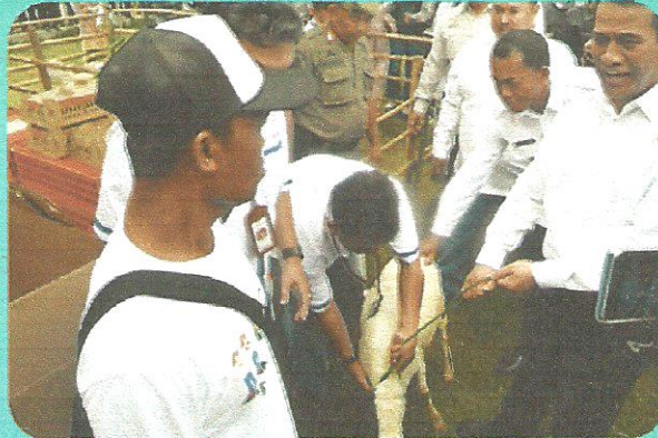
Penyerahan Bantuan Ternak Domba oleh Menteri Pertanian di Kab Subang