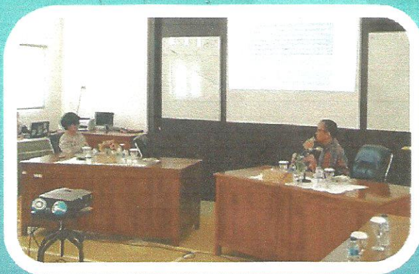
Arahan Inspektur jenderal Kementerian Pertanian