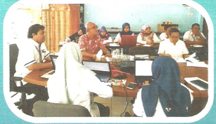
Evaluasi pengembangan sapi Belgian Blue