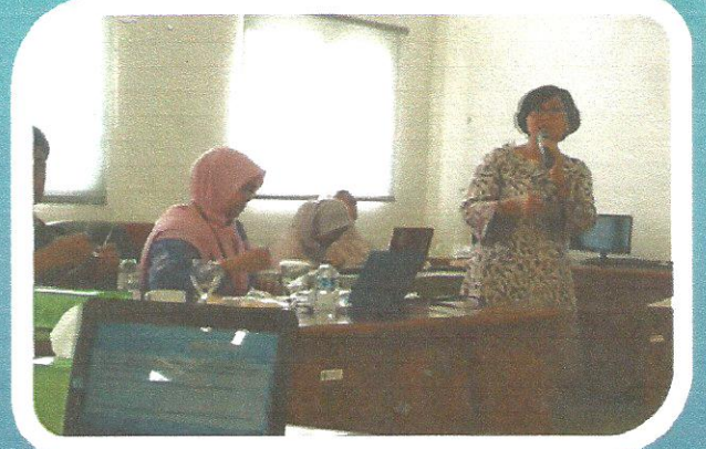
Arahan Direktur Direktur pada FGD Pakan