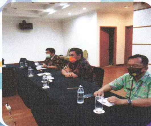
Koordinasi Uzi Zuriat di Depok