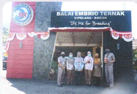
Studi Titu PPID dari BKP Kelas 1 Semarang