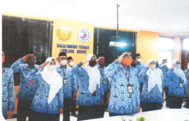
Upacara Virtual 17 Agustus 2020